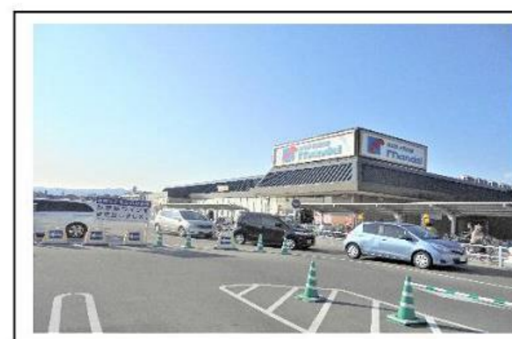
スーパー万代 約690m 徒歩9分