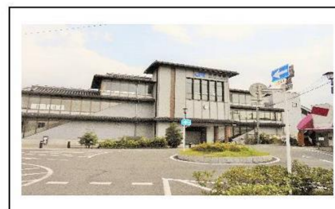
法隆寺駅 約1040m 徒歩13分