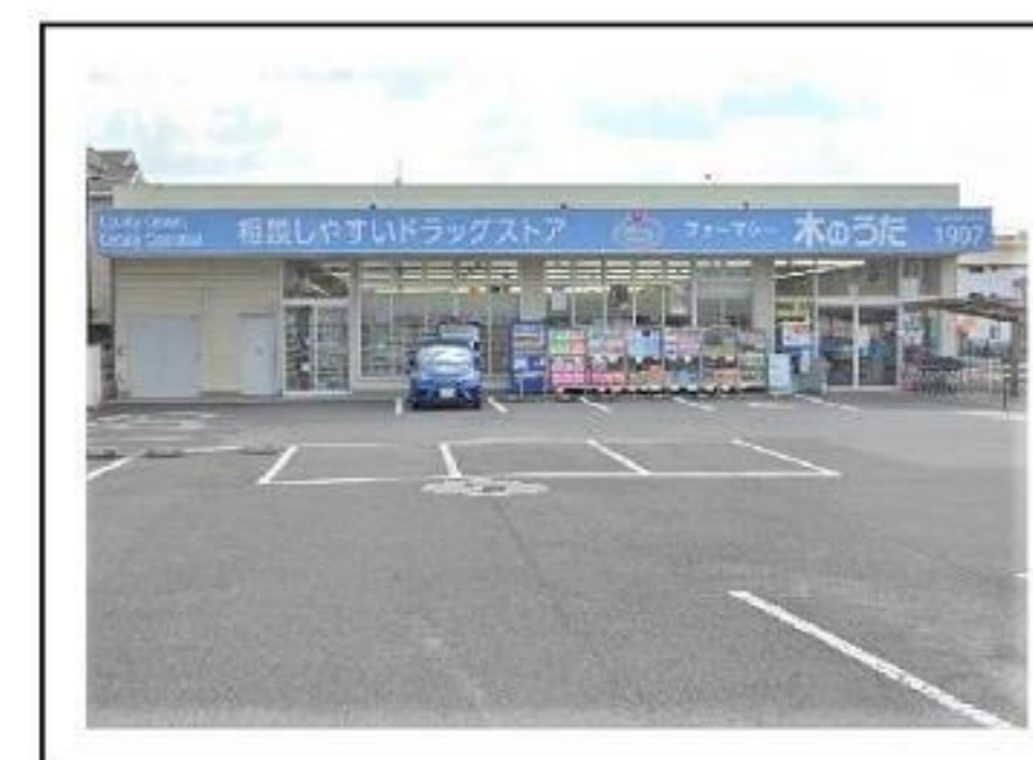
木のうた 約560m 徒歩7分