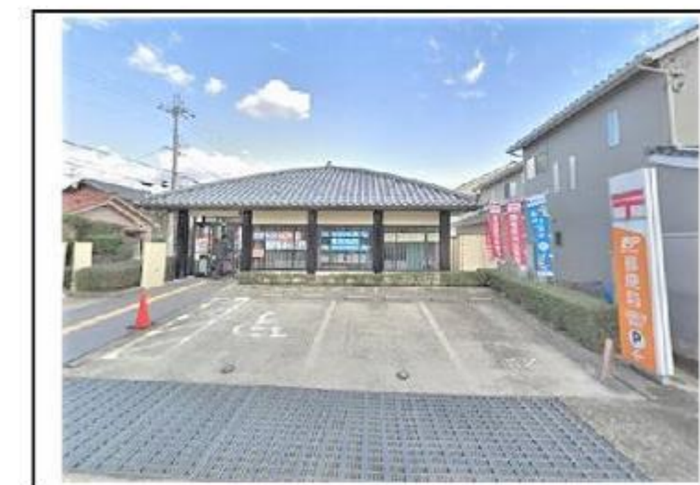
法隆寺郵便局 約280m 徒歩4分