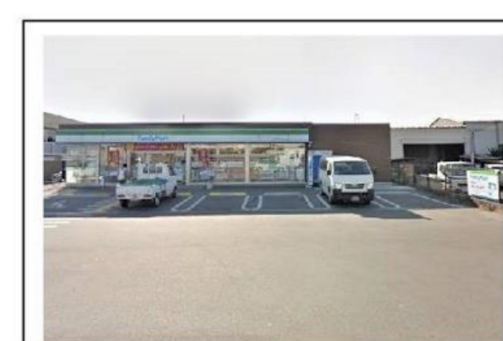
ファミリーマート 約85m 徒歩1分