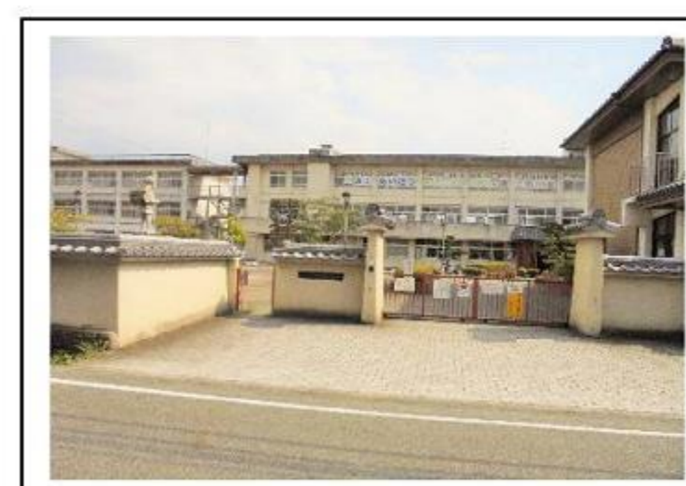
斑鳩東小学校 約530m 徒歩7分